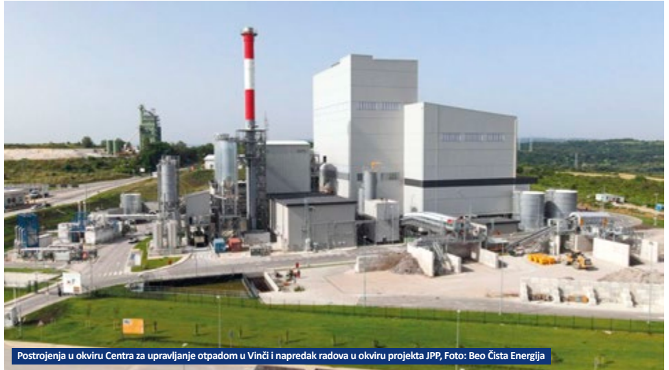
Postrojenje u okviru Centra za upravljanje otpadom u Vinči i napredak radova u okviru projekta JPP

Mladenović je izneo podatak da je nesanitarna deponija u Vinči bila među pedeset najvećih aktivnih nesaniarnih deponija na svetu, sve do avgusta 2021. godine. Šesto kamiona otpada je svakodnevno dopremano u Vinču, 1.500 tona otpada iz domaćinstva i 3.000 tona otpada od građenja i rušenja. Na površini od 45 hektara, nesanitarna deponija je na određenim mestima dostizala visinu i do 80 metara. Sam gospodin Mladenović je izjavio da je bio u neverici veličinom deponije kada je prvi put video. Od 1977. godine, kada je ova deponija puštena u rad, procedne vode su slobodno tekle i zagađivale Ošljanski potok i Ošljansku baru, a samim tim i reku Dunav, kao i okolno poljoprivredno zemljište. Požari, postojanje stalnih podzemnih tinjajućih požara, kao i dva velika površinska požara, 2017. i 2021. godine. Procedne vode ili nekontrolisano oticanje procednih voda u Dunav (preko 90.000 m 3 /g). Stalna pojava klizišta zbog preopterećenosti. Nekontrolisano dovoženje otpada, u pogledu količine i vrste otpada. Svi ovi problemi su doprineli povećanje opšte svesti da se ovo pitanje mora hitno rešiti. Grad Beograd se odlučio da zatvori staru deponiju u Vinči i izgradi savremeni centar upravljanje otpadom kroz javno-privatno partnerstvo sa Beo čistom energijom koju su osnovali Francuski Suez, sada Veolia 40%, japanski konglomerat Itochu 40% i panevropski fond Marquerite 20%, a projekat se realizuje uz podršku